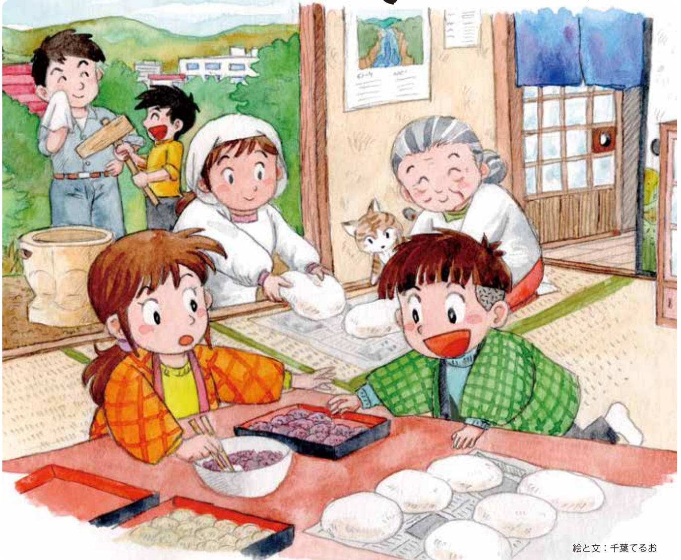
絵と文：千葉てるお