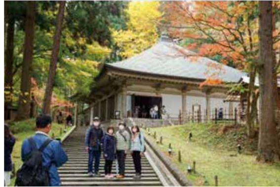
平泉町 国宝 金色堂