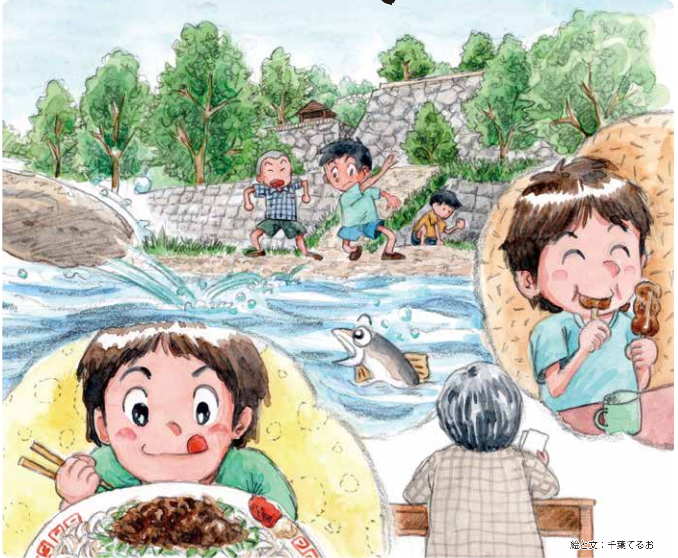
絵と文：千葉てるお