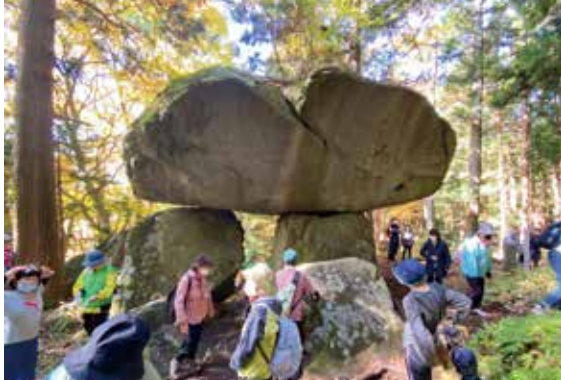
遠野市 名勝 續石

今年度は2年ぶりに遠野、平泉で健康ウォーキングを実施しました。両日とも天候に恵まれ、5歳から80歳までの合わせて160名が遠野ウォーキング協会、平泉歩こう会の全面的なご支援の下それぞれ6キロ、9キロのコースを満喫することができました。遠野市ではSL銀河も間近で見ることができ、平泉では終盤を迎えた紅葉の中尊寺と月見坂を堪能することができました。コロナ禍のため、参加者を制限せざるを得ない状況となりましたことについてお詫びを申し上げます。