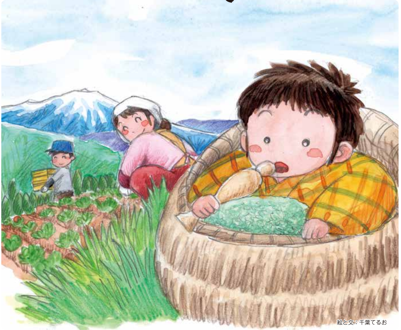
絵と文：千葉てるお