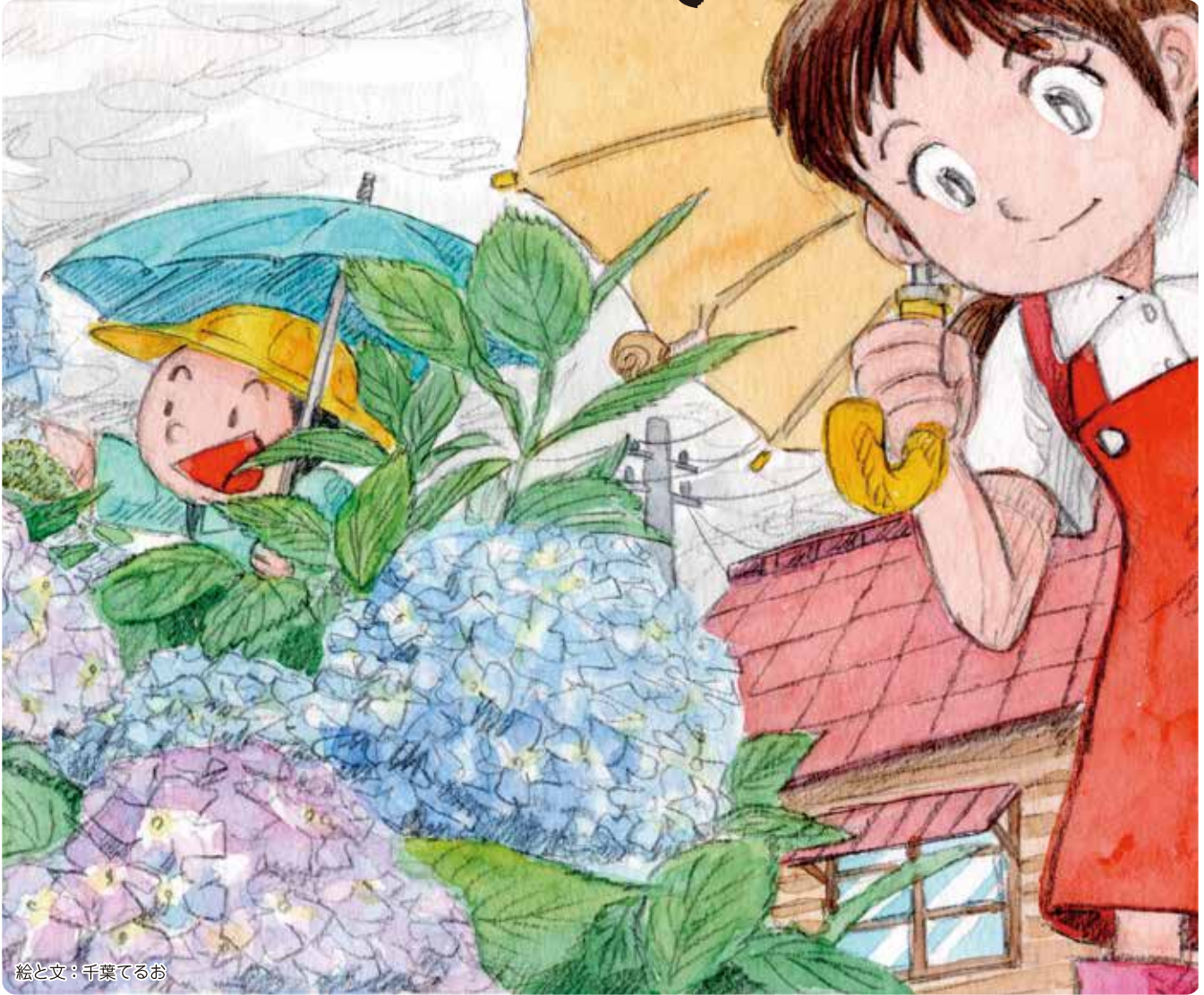
絵と文：千葉てるお