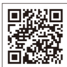
(申請書ダウンロード)