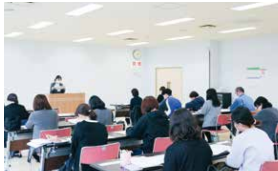
大船渡会場(シーパール)