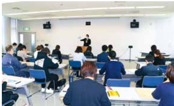
宮古会場(シーアリーナ)

今年度も今後社会保険労務士によるセミナー、年金受給間近の被保険者等を対象にした年金制度と手続きについて、昨年度実施できなかった地区において研修を行うこととしています。多くの皆様のご参加をお待ちしております。