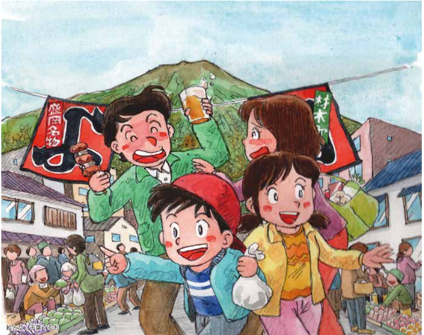
絵と文：千葉てるお