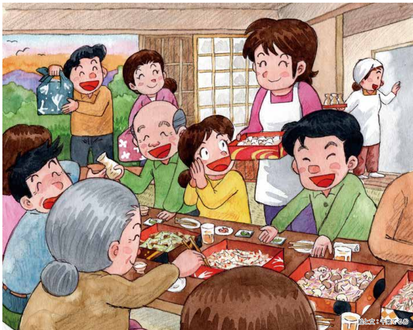
絵と文：千葉てるお