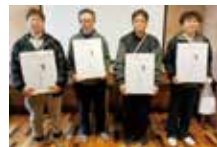
優勝チーム：(株)西浦精機