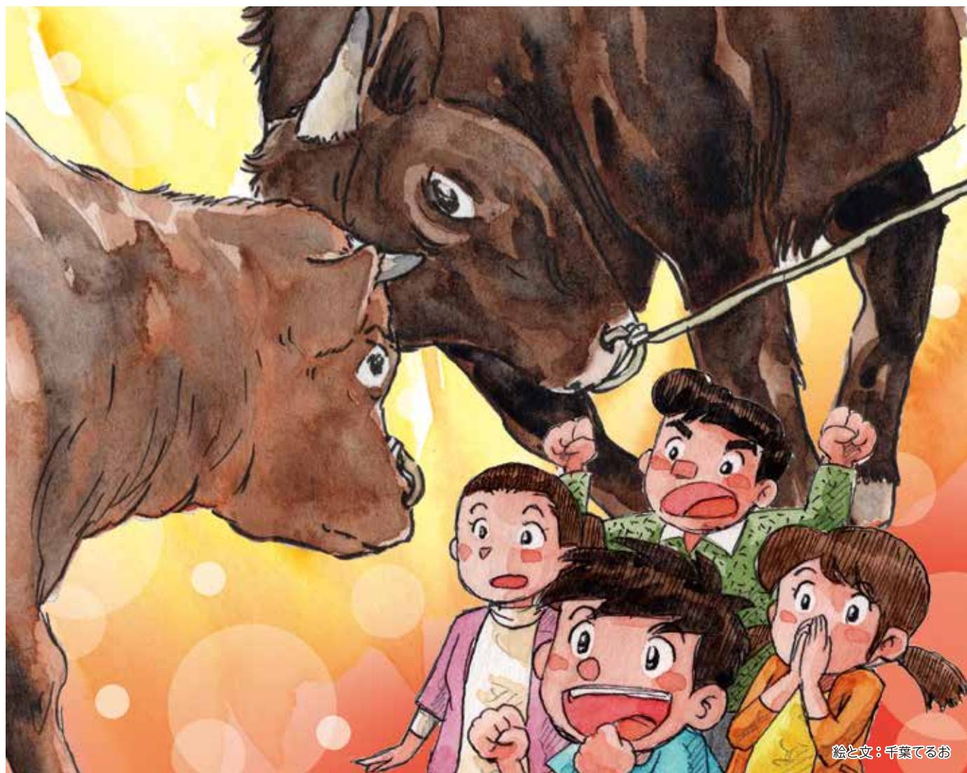
絵と文：千葉てるお