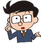
休日は労働義務がない日のことです！

一方、休暇とは、労働者の労働義務がある日に会社がその労働義務を免除することです。したがって、労働義務がある日にしか休暇を取ることはできません。労働基準法にも、休暇は労働日(労働義務のある日)にのみ取得できることが定められています。