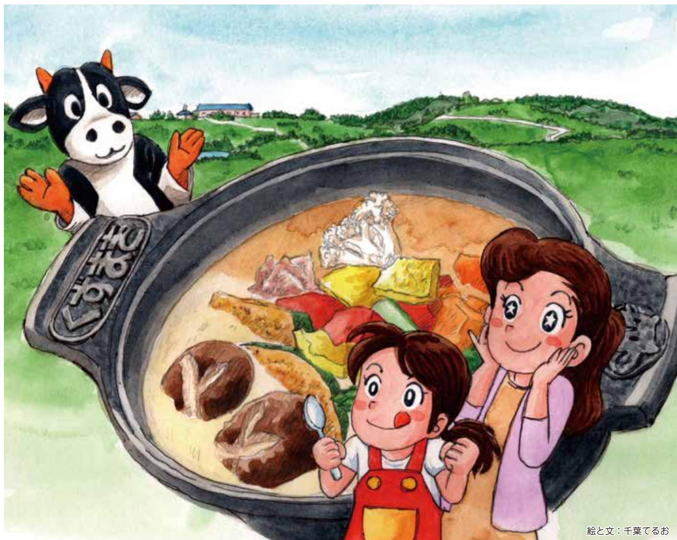
絵と文：千葉てるお