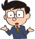
この二つは会社が労働義務を免除する日のことです！

社労士 はい。休業とは、休暇と同じく、労働者の労働義務がある日に会社がその労働義務を免除することです。休業には、労働基準法で定められている産前産後休業、育児介護休業法で定められている育児休業や介護休業などがあります。通常、休業している期間中には労働者の労働義務が既に免除されており、休暇を取得することができません。